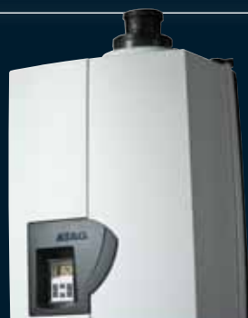
Uw ATAG adviseur: